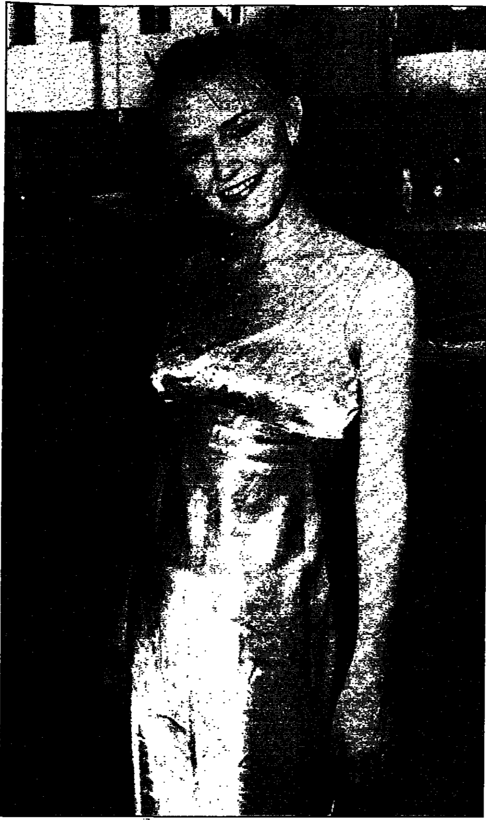
دومينيك سواين نجمة فيلم 'الرباطا، شيمت حفل العرض الاول للفيلم في ميلبورن ليلة اسن الاول

وكانت الشرطة الهولندية في بلومندال باب هاغن النيا وكالة (فرانس برس)، كتبه رفض إعطاء تفاصيل أو الإدلاء بتعليق مؤكدا ان تحقيقا يجري حاليا في هذا الصدد.